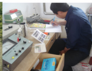
榆林市榆林学院 植物系学部