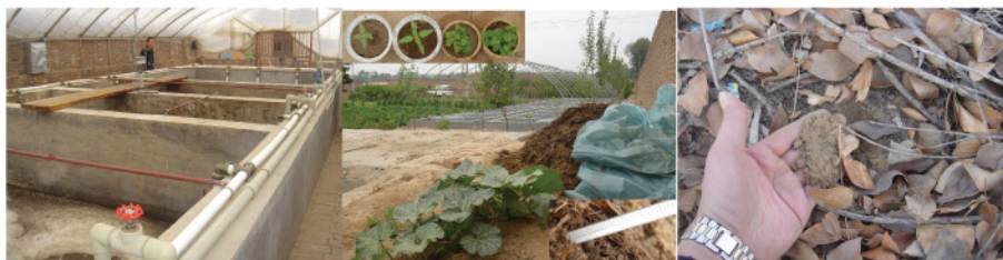
2003年12月、日本から 液肥プラントを導入