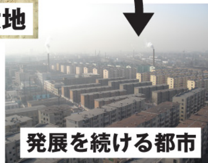
発展を続ける都市